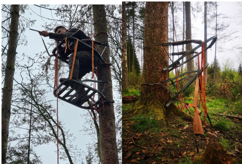
Abb. 1 Anschlagmöglichkeiten auf dem Klettersitz - ANW HSG Gö Abb. 2 Klettersitzausrüstung mit Übungswaffe- ANW HSG Gö

Klettersitze sind eine gute Möglichkeit die jagdlichen Optionen zu erweitern. Ein professioneller Einführungskurs ist dabei sehr zu empfehlen, damit einem der richtige und sichere Umgang gezeigt wird. Wir bedanken uns bei HessenForst und dem Team aus dem Forstamt Frankenberg-Vöhl und freuen uns auf das nächste Seminar.